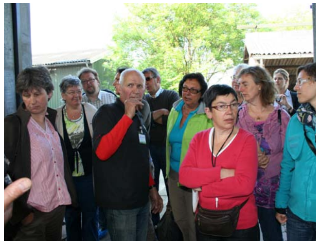
Uitleg van op het jongfokveebedrijf Sleutjes in St-Michielsgestel

Deze nieuwsbrief is een publicatie van de projectverantwoordelijke van het project GROELkans. Dit project wordt gerealiseerd in het kader van het Interreg IVa programma voor de Gensregio Vlaanderen-Nederland, medegefinancierd vanuit het Europees Fonds voor Regionale Ontwikkeling.