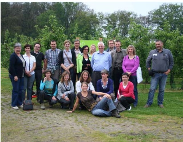
De groep deelnemers van de studiereis naar Nederland

Meer weten? Contacteer Wouter Goolaerts • wouter.goolaerts@boerenbond.be • tel. +32 (0) 16 28 60 28 • Plattelandsklassen vzw